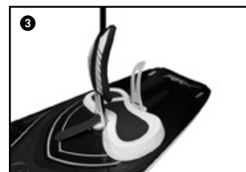
3 Insert the strap lock in the strap and pass the velcro in the appropriate hole. Enfiler le strap lock dans le strap en passant la sangle velcro dans le passage prévu.