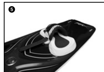
5 Place the first velcro strap. Placer la première sangle velcro.