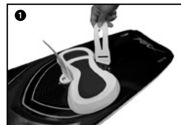
1 Place each straps lock on the pad. Placer les straps lock sur les pads.