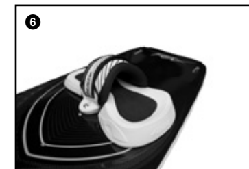
6 Place the second velcro strap on top the first one. Placer la seconde sangle velcro sur la première.