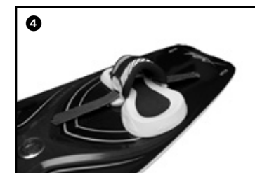
4 Set up the height of the strap for your size by gliding the strap over the strap lock. Régler la hauteur du strap en fonction de votre pointure en faisant glisser le strap sur les straps lock.