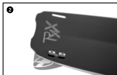
2 Place the fin into the hole of the board. Placer l'aileron dans le trou de la planche.

Faire correspondre les ailerons verts aux trous verts de la planche. Idem pour les rouges.