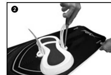
2 Screw in the strap lock. Serrer les vis.