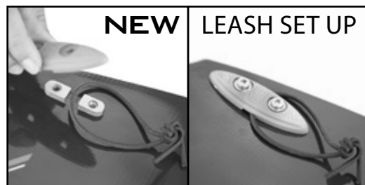
Place the leash loop into the notch. Placer le bout de votre leash dans l'encoche prévue à cet effet.

Because of the asymmetric fin profile, the fins are color coded (red and green) to facilitate their assembly. The matching color is also present inside the fin holes on all of our twin tip boards. As a result, mounting the fins is really easy: red on red, green on green. The box part can be mounted in either orientation.