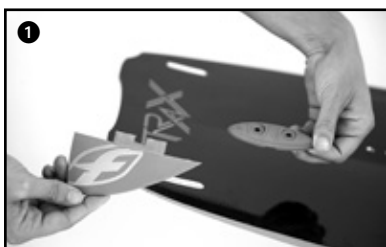
1 Have correspond the green fins to the green holes of the board. Repeat the step for red fins.

Pour respecter le sens du profil asymétrique, les ailerons ont un code couleur au talon (rouge et vert). Cette couleur se retrouve dans la partie femelle des planches. En outre, les parties « box » supérieures n'ont pas de sens ou de positions précises.