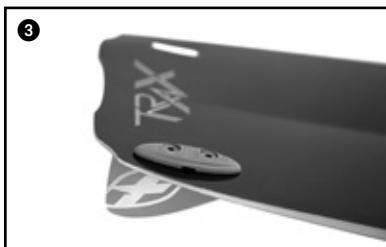
3 Fit the box onto the upper part of the fin. Encastrer le box dans la partie haute de l'aileron.